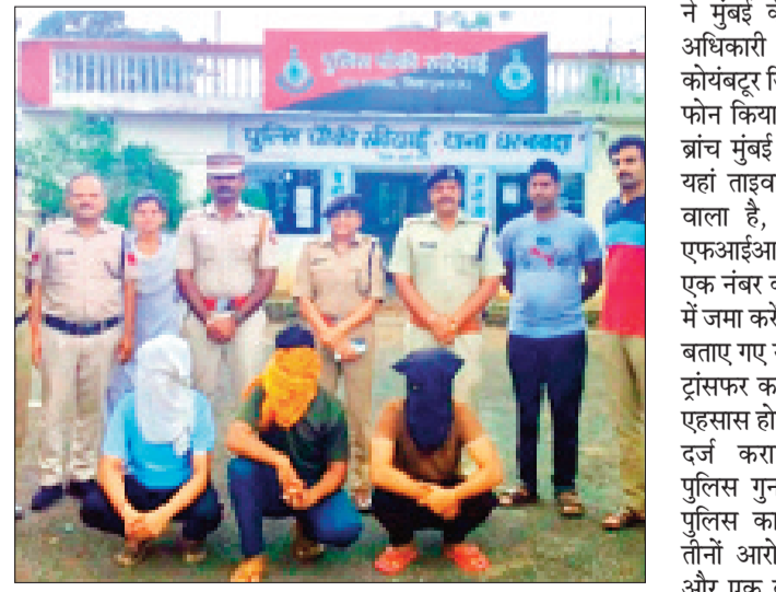
हरिभूमि न्यूज ॥ गुना

गुना जिले के तीन लड़कों ने मुंबई के क्राइम ब्रांच अधिकारी बनकर तमिलनाडु के कोयंबटूर जिले एक व्यापारी से 67 लाख रुपए की ऑनलाइन ठगी की, इसके बाद कोयंबटूर में मामला दर्ज हुआ और