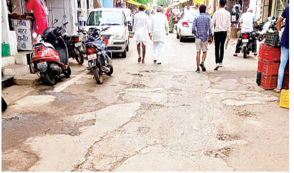
हरिभूमि न्यूज ॥ राजगढ़

वर्तमान नगर पालिका परिषद के पूर्व की परिषद के जिम्मेदारों ने नगरीय विकास के जुड़े कार्यों में आगे की सोच के हिसाब से काम नहीं किया। यही कारण है कि पूर्व के कुछ निर्णय अब वर्तमान में नगरवासियों की पीड़ा के रूप में उभरकर सामने आ रहे हैं।