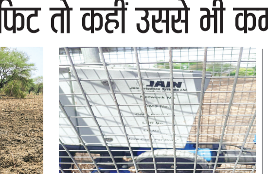
हरिभूमि न्यूज ॥ ब्यावरा