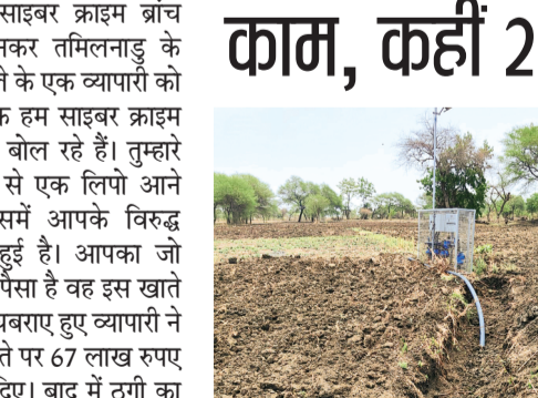
हरिभूमि न्यूज ॥ ब्यावरा

उसको ही पेटे पर पाइप लाईन डालने का ठेका दे दिया। जिसमें न तो कोई अनुभवी कर्मचारी है न विभाग के अधिकारी मौके पर जाकर काम को देख रहे हैं। यही कारण है कि प्रशासन के नियम अनुसार पाइप लाइन को कम से कम 3 फिट गहरी जमीन के अंदर डालनी है पर कहीं पर 2 फिट तो कहीं पर 1.6 फिट गहरी डाल ही है जो आज के समय में किसानों ने आपने खेतों में गहरी जुताई की है जिसमें ही उखड़ गई।